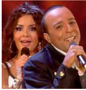
AZERBAÏDJAN AySel & Arash "Always"