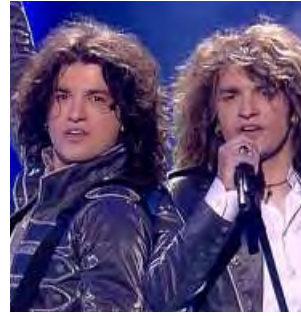
MACEDOINE Next Time "Neshto shto ke ostone "