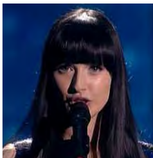
ESTONIE Urban Symphony "Rändajad"