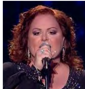
MALTE Chiara "What If We"

A: Pedro Marques C: Pedro Marques & Paulo Pereira C.O. : -