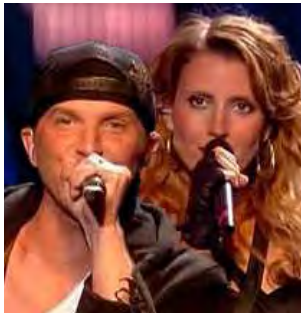
FINLANDE Waldo's People "Lose Control"

A : Laurentiu Duta & Alexandru Pelin C : Laurentiu Duta, Ovidiu Bistriceanu & Daris Mangal C.O. : -