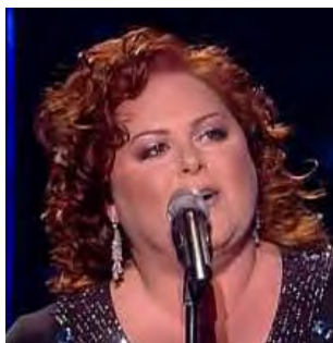
MALTE Chiara "What If We"

A: Gregory Bilsen C: Marc Paelinck C.O. : -