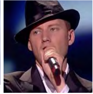
LITUANIE Sasha Son "Love"

A: Graig Porteils & Cameron Giles- Webb C: Dimitris Kontopoulos C.O. :-