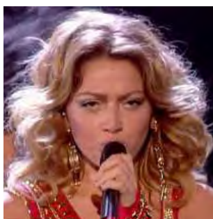
TURQUIE Hadise "Düm tek tek"