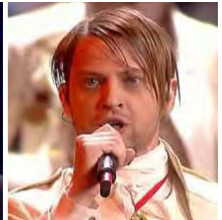
BOSNIE-HERZEGOVINE Regina "Bistra voda"

A: Gregory Bilsen C: Marc Paelinck C.O. : -