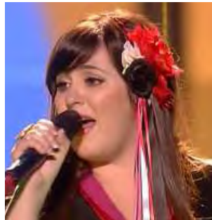
PORTUGAL Flor-de-lis "Todas as ruas do amor "

A: Waldo, A. Lehtonen, Karima & A. Kratz Gutá C: A. Lehtonen & Karima C.O. : -