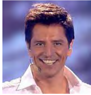
GRECE Sakis Rouvas "This Is Our Night"