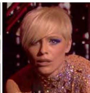
ESPAGNE Soraya "La noche es para mí (The Night Is For Me)"

A: Waldo, A. Lehtonen, Karima & A. Kratz Gutå C: A. Lehtonen & Karima C.O. : -