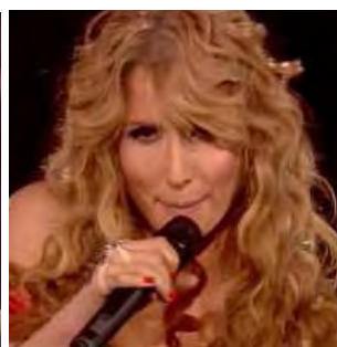
UKRAINE Svetlana Loboda "Be My Valentine! (Anti-crisis Girl)"

A: Alexander Rybak C: Alexander Rybak C.O. : -