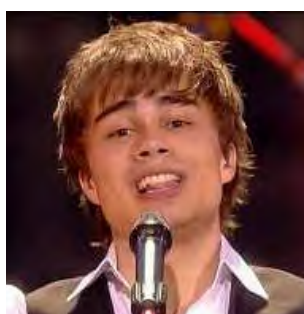
NORVEGE Alexander Rybak "Fairytale"

A: Alexander Rybak C: Alexander Rybak C.O. : -