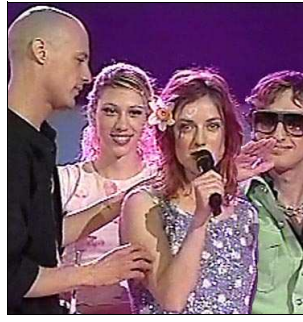
ISRAEL PingPong "Sa' me' ach"

A: Ronen Ben-Tal C: Guy Assif & Roy Arad C.O. : -