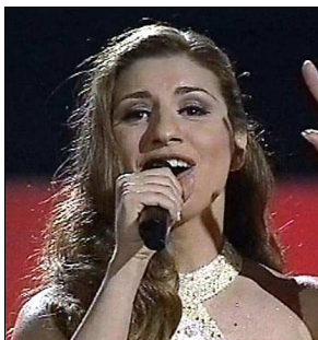
TURQUIE Pinar & the SOS "Yorgunum anla"

A: Reynard Cowper C: Reynard Cowper C.O. : -