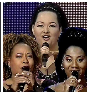
AUTRICHE The Rounder Girls "All to you"

A / C: Gerry Simpson & Raymond J Smyth C.O. : -