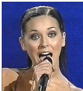
RUSSIE Alsou "Solo"