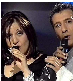
CHYPRE Voice "Nomiza"

A: Silvio Pezzuto C: Silvio Pezzuto C.O. : -