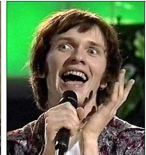
LETONIE Brainstorm "My star"

A: Gerritt aan't Goor C: Luca Renta C.O. : -