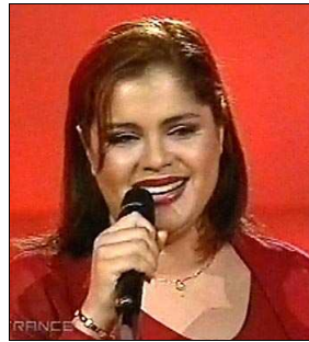
FRANCE Sofia Mestari "On aura le ciel"

A: Jana Hallas C: Pearu Paulus, Ilmar Laissar & Alar Kotkas C.O. : -