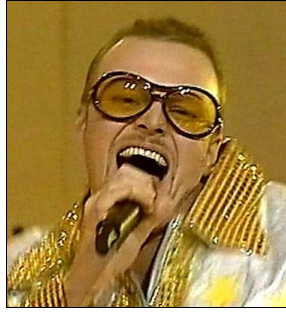
ALLEMAGNE Stefan Raab "Wadde hadde dudde da?"