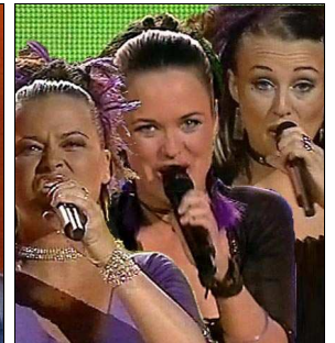
NORVEGE Charmed "My heart goes boom"