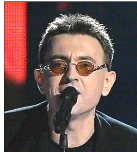
ROUMANIE Taxi "The moon"

A: Benoît Heinrich C: Pierre Legay C.O. : -