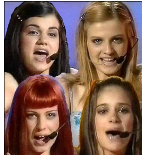
MACEDOINE XXL "100 % te ljubam"