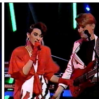
YUGOSLAVIE Riva "Rock me "

A: Joachim Horn-Bernges C: Dieter Bohlen C.O. : -