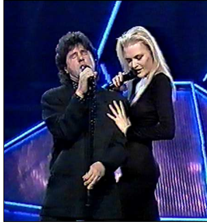
ITALIE Anna Oxa & Fausto Leali "Avrei voluto"