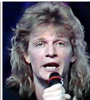
SUEDE Tommy Nilsson "En dag"