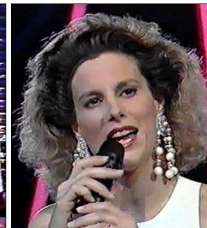
GRECE Mariana "To diko sou asteri"

A: Marie-Louise Werth C: Marie-Louise Werth C.O. : Benoit Kaufman