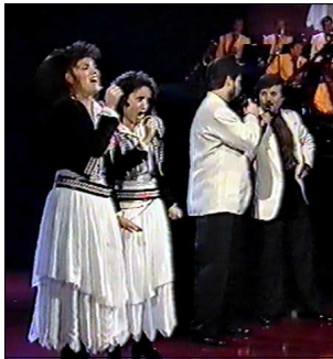
TURQUIE Pan "Bana bana"