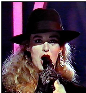
PORTUGAL Da Vinci "Conquistador"

A: Leiv N. Grøtte C: Inge Enoksen C.O. : Pete Knutsen