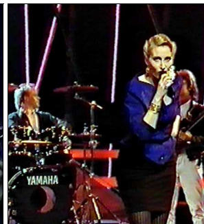
LUXEMBOURG Park Café "Monsieur"