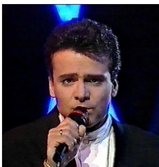
ALLEMAGNE Nino de Angelo "Flieger"

A: Valgeir Guðjónsson C: Valgeir Guðjónsson C.O. : Valgeir Guðjónsson