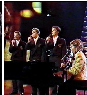
SUISSE Furbaz "Viver senza tei"

A: Efi Meletiou C: Marios Meletiou C.O. : Haris Andreadis