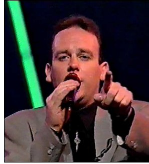
IRLANDE Kiev Conolly & The Missing Passengers "The real me"

A: Shaïke Païkov C: Shaïke Païkov C.O. : Shaïke Païkov