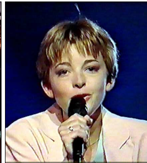
BELGIQUE Ingeborg "Door de wind"

A: Timur Selçuk C: Timur Selçuk C.O. : Timur Selçuk