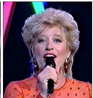
DANEMARK Birthe Kjær "Vi maler byen rød"