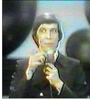
SUISSE Henri Dès "Retour"