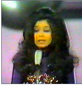
PAYS-BAS Particia & Hearts of soul "Waterman"

A: Pieter Goemans C: Pieter Goemans C.O. : Dolf van der Linden