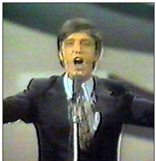
BELGIQUE Jean Vallée "Viens l'oublier"

A: Dusan Velkaverh C: Mojmir Sepe C.O. : Mojmir Sepe