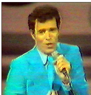
ESPAGNE Julio Iglesias "Gwendolyne"