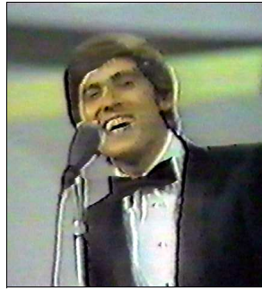
ITALIE Gianni Morandi "Occhi di ragazza"