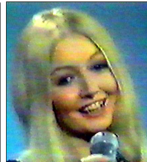
ROYAUME-UNI Mary Hopkin "Knock knock (Who's there?)"