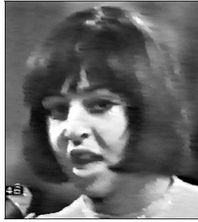
LUXEMBOURG Vicky "L'amour est bleu"

A: Gerrit den Braber C: Johnny Holshuysen C.O.: Dolf van der Linden