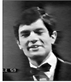
AUTRICHE Peter Horten "Warum es hunderttausend sterne gibt"

A: Pierre Cour C: André Pop C.O.: Johannes Fehring