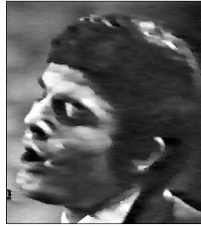
YOUgoslavIE Lado Leskovar "Vse roze sveta"

A: Serge Gainsbourg C: Serge Gainsbourg C.O. : Aimé Barelli