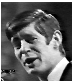
BELGIQUE Louis Neefs "Ik heb zorgen"