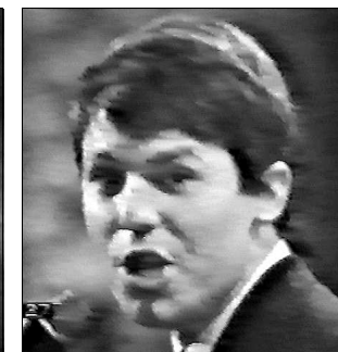
ESPAGNE Raphael "Hablemos del amor"

A: Bill Martin C: Phil Coulter C.O.: Kenny Woodman