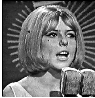
LUXEMBOURG France Gall "Poupée de cire, poupée de son"