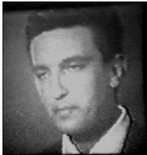
YOUgoslavie Vice Vukov "Ceznja"

A: Reino Helismaa C: Toivo Kaerki C.O. : George de Godzinsky