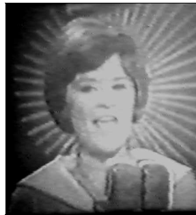
NORVEGE Kirsti Sparboe "Karusell"

A: Udo Jürgens C: Udo Jürgens C.O. : Gianni Ferrio