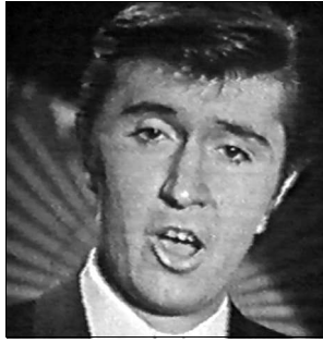
ITALIE Bobby Solo "Se piangi, se ridi"