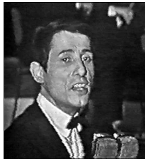
AUTRICHE Udo Jürgens "Sag ihr, ich lass sie grüssen"