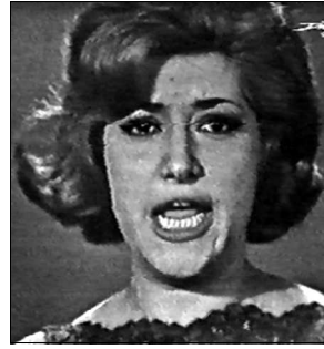
ESPAGNE Conchita Bautista "Que bueno, que bueno"