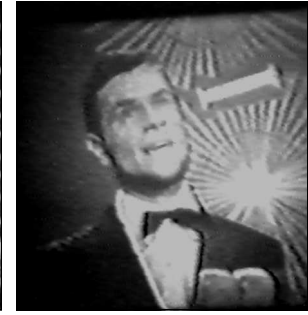
FINLANDE Viktor Klimentko "Aurinko laskee lanteen"

A: Serge Gainsbourg C: Serge Gainsbourg C.O. : Alain Goraguer