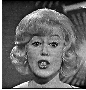
ROYAUME-UNI Kathy Kirby "I belong"